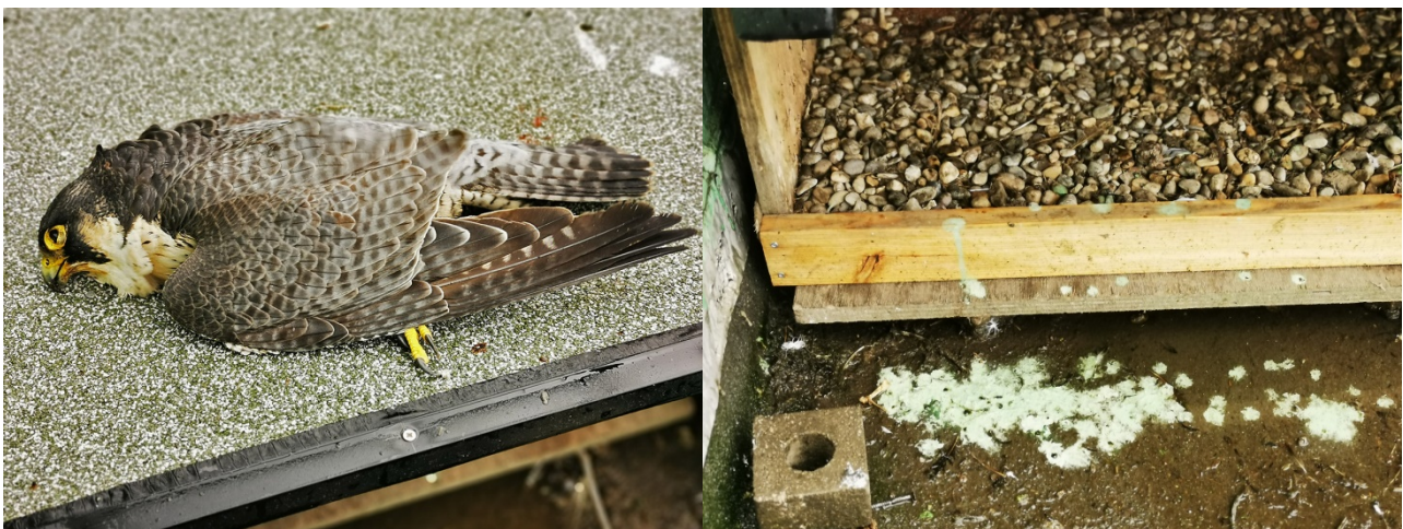
Abb. 4: links der tote Wanderfalken, rechts die grünlichen Kotspuren, 17.01.2022.

Der Vogel wurde dem zuständigen Veterinäramt übergeben und das Untersuchungsergebnis bestätigte unsere Vermutung: In den Proben wurde RNA spezifisch für hochpathogenes Influenza A Virus des Subtyps H5N1 nachgewiesen. Aufgrund dieser Feststellung verfügte das Veterinäramt eine Aufstallungspflicht für alle Geflügelhalter im relevanten Gebiet.