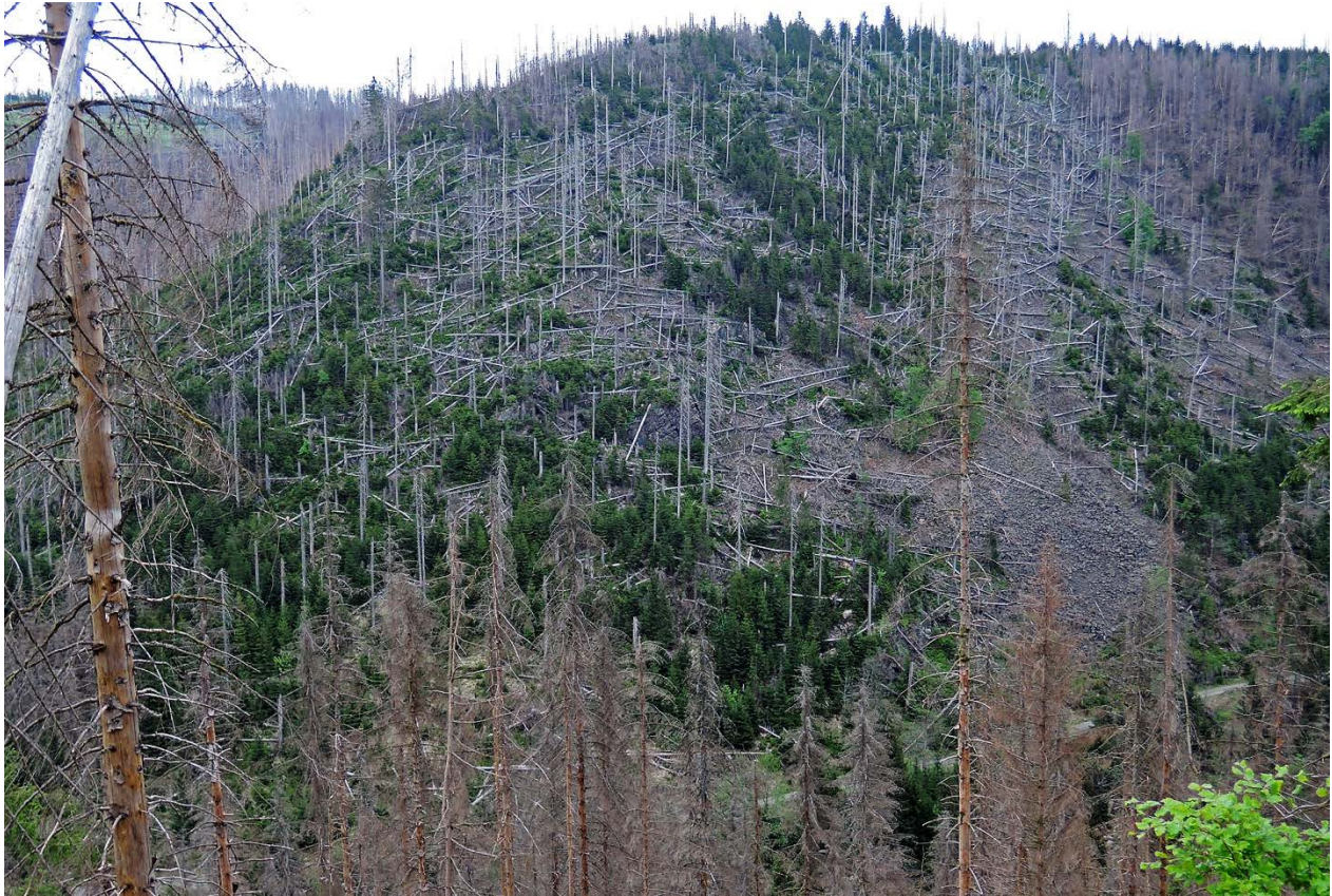
Abb. 2: Waldsterben im Harz, 16.05.2022.

Trotz dieser Verluste waren die felsbrütenden Wanderfalken im niedersächsischen Harz 2022 im Vergleich zu den beiden Vorjahren etwas erfolgreicher. Die trockene Witterung mag vor allem zu der zwischenzeitlich erreichten Zahl von 28 ausfliegefähigen Jungvögeln beigetragen haben. Die Grafik in Abb. 3 macht deutlich, wie diese Zahl einzuordnen gewesen wäre, zumal im Weserbergland 2022 gar keine Jungvögel bei felsbrütenden Wanderfalken mehr ausgeflogen sind.