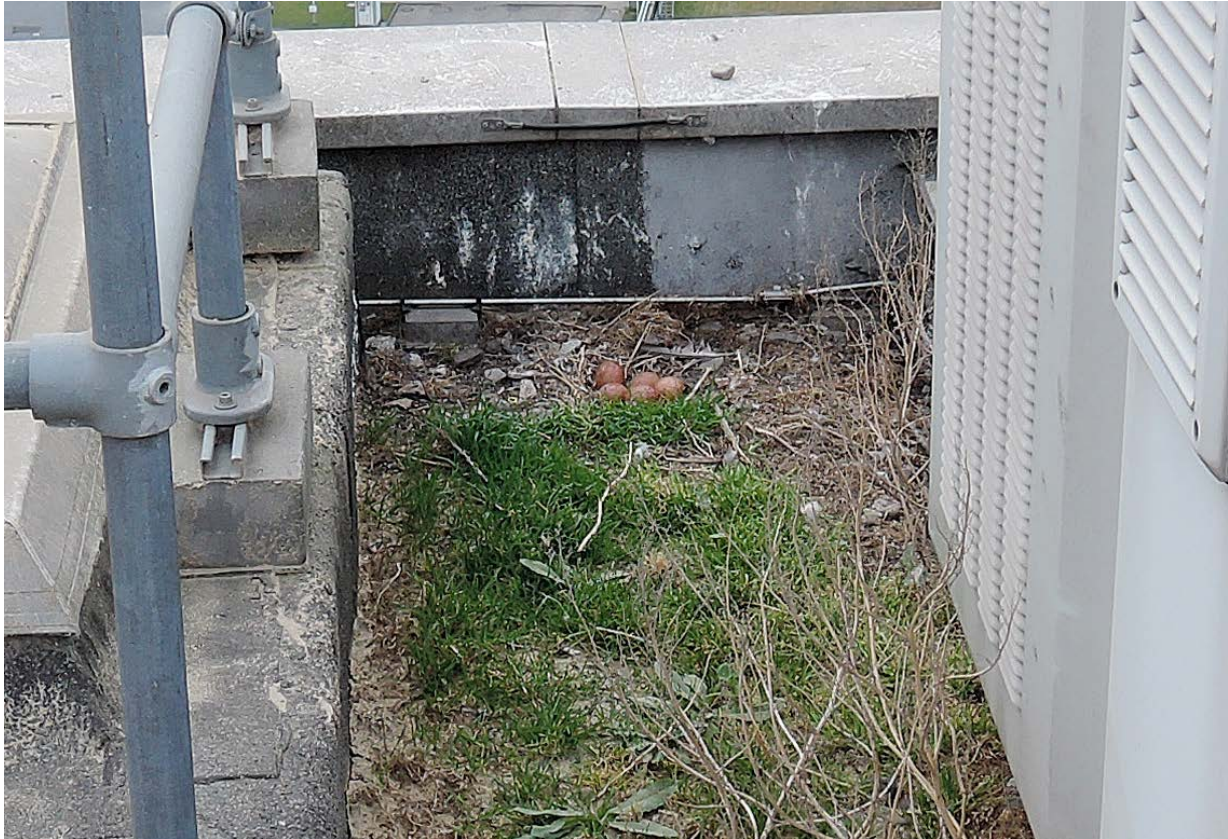
Abb. 1: Fünfergelege, 03.03.2022.

In der dritten Mai-Dekade ließen hohe Jungenzahlen bei den Gebäudebrütern im nördlichen Weserbergland und in der Hildesheimer Börde, aber vor allem bei den Felsbrütern im niedersächsischen Harz – dort mit 4 Viererbruten – auf ein Rekordergebnis an ausfliegenden Jungfalken hoffen. Auch ein 5er-Gelege auf dem Dach eines Gebäudes machte Hoffnung (Abb. 1). Es wurden aus diesem Gelege allerdings „nur“ 3 Falken flügelte.