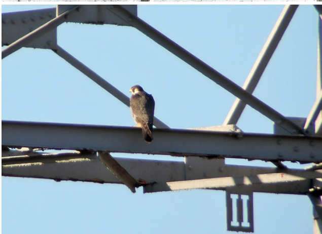
Bildergalerie 2022.