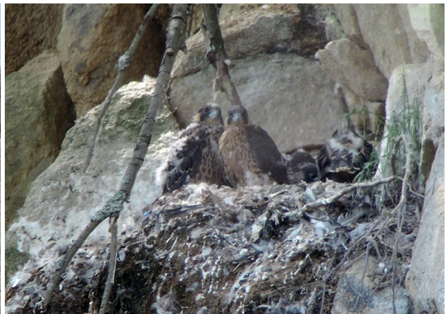
Bildergalerie 2022.