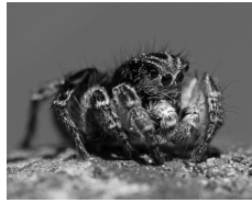
V-Fleck-Springspinne ( Aelurillus v-insignitus )