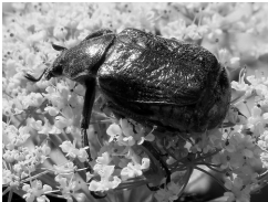
Grüner Edelscharrkäfer ( Gnorimus nobilis )