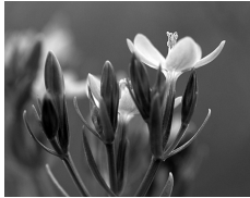
Tausendgülden- kraut ( Centaurium sp. )