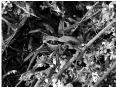
Gestreifte Scheintarantel ( Alopecosa striatipes )