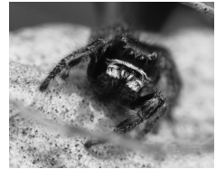
Kreuz-Springspinne ( Pellenes tripunctatus )

Auch auf dieser Seite gibt es einige besonders bemerkenswerte Spezies. Es beginnt mit der Gestreiften Scheintarantel, dies ist der bisher nördlichste Fund in Deutschland. Die Springspinne Sibianor laeae hat keinen Trivialnamen und ist lt. AraGes der erste Fund in Niedersachsen überhaupt.